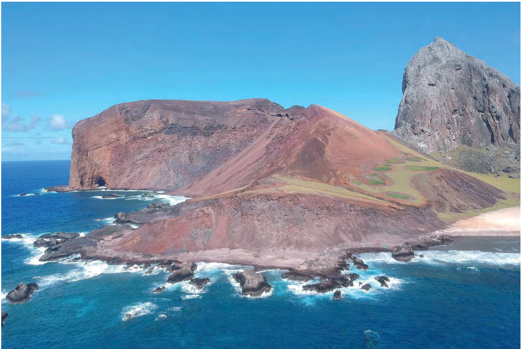
Vista aérea da Ilha da Trindade, que fica a cerca de 1.000 km da costa capixaba: localização estratégica por estar situada no centro da Anomalia Magnética do Atlântico Sul