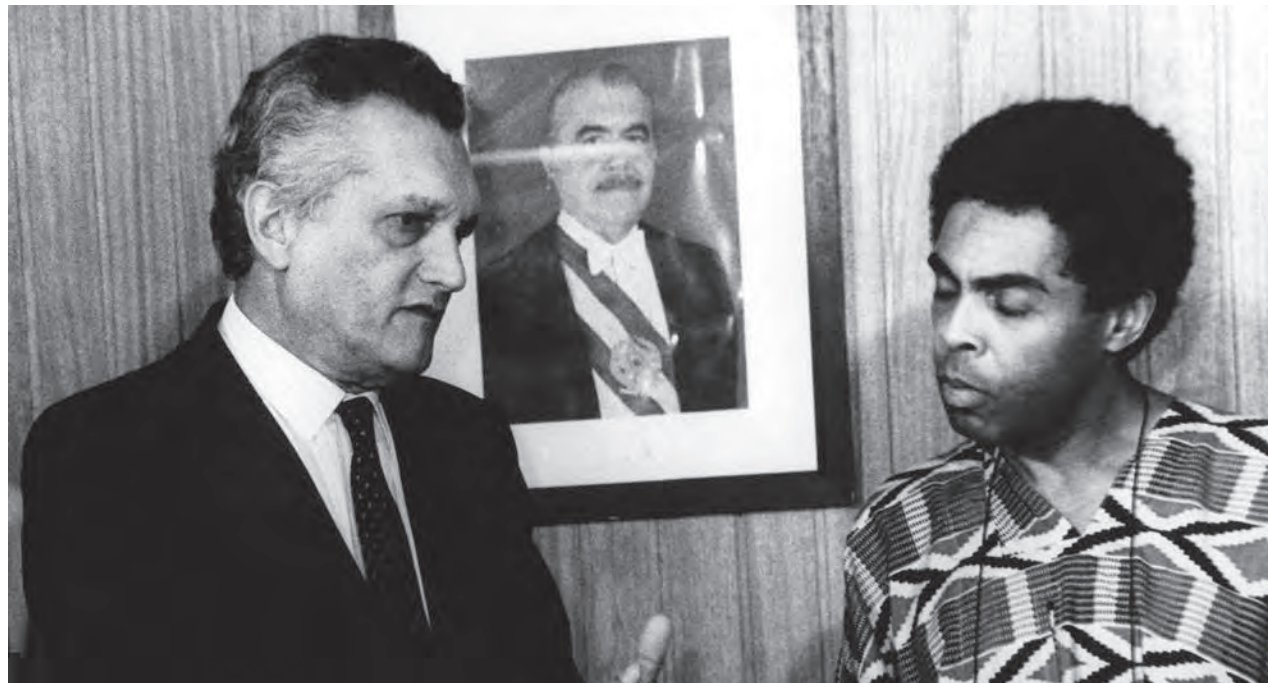
Celso Furtado, então ministro da Cultura, cargo que ocupou entre 1986 e 1988, recebe o compositor Gilberto Gil: criando as primeiras leis de incentivo na área