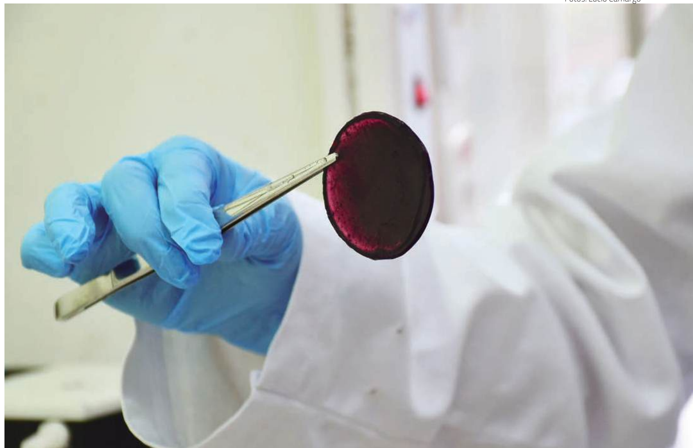
Manipulação de membrana em laboratório da FT: feito com polímero sintético, material é enriquecido com derivado de óxido de grafeno