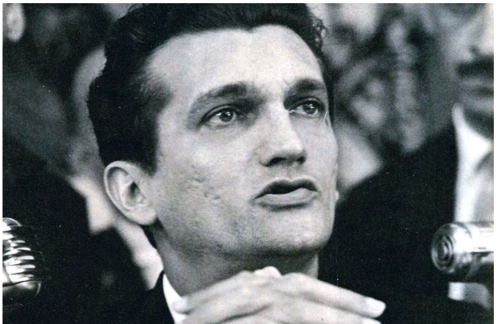
Celso Furtado concede entrevista em 1963 como ministro do Planejamento do governo de João Goulart, que foi deposto pelos militares: intelectual na linha de frente