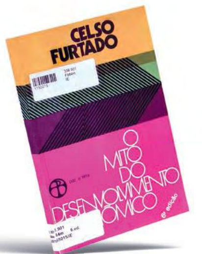
Continua na página 6