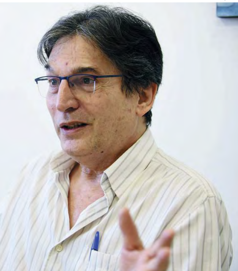
ção das frequentes viagens do pai

para New Haven (Estados Unidos), onde atuaria como pesquisador da Universidade de Yale. Porém, em 1965, transferiu-se para Paris, onde passou a lecionar na mesma Sorbonne em que havia defendido seu doutorado.