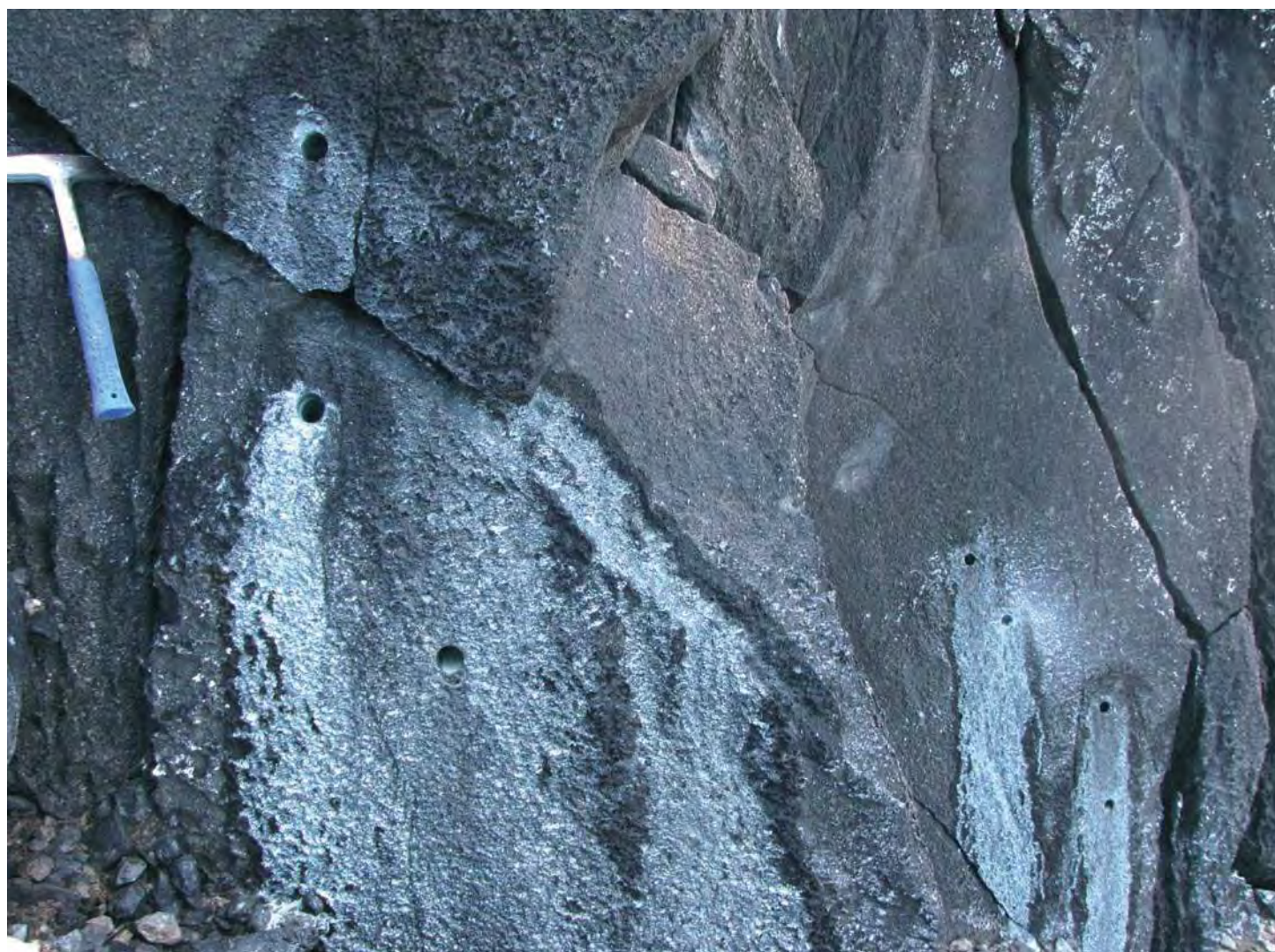
Rochas ígneas na Ilha da Trindade: vestígios do último vulcão formado no Brasil a partir de um derramamento de magma ocorrido há cerca de 300 mil anos

Os dados sobre a longevidade da Anomalia Magnética do Atlântico Sul possibilitam a obtenção de novas informa-